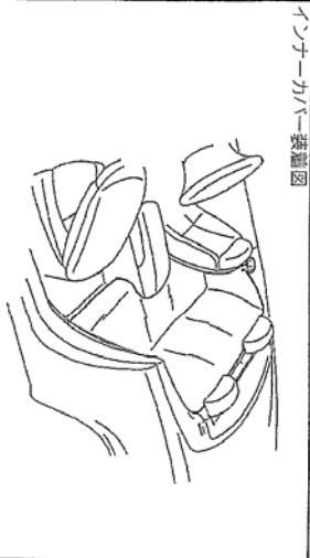
インナーカバー装着図